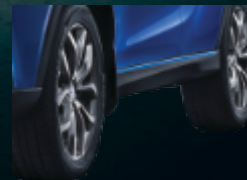
Dinamični moderni kotači