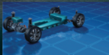
Napredna tehnologija, učinkovita snaga